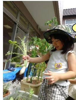
野菜の収穫をしました！