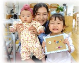
手作りのおもちゃ できたよ～♪