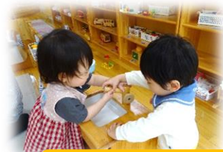
みずまわりの修理はまかせて