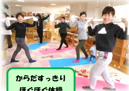
からだすっきり ほくほく体操