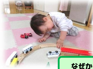
なぜかウラが気になるふたり