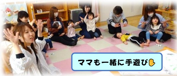
ママも一緒に手遊び👉