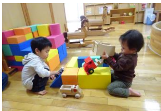
上手にならんだよ