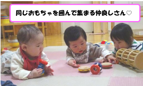
同じおもちゃを囲んで集まる仲良しさん♡