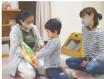
ボクがよんであげるね