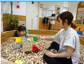
ボールプールはじまりました