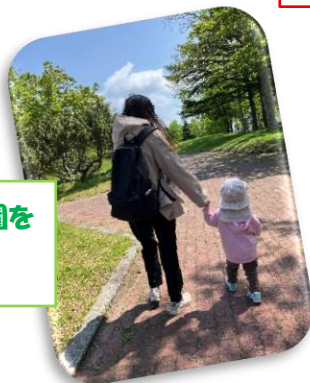
天北緑地公園をお散歩中