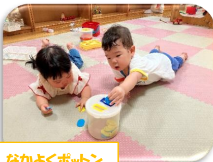
なかよくポットン