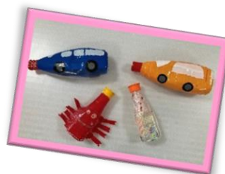
手作り広場「水てっぽう」