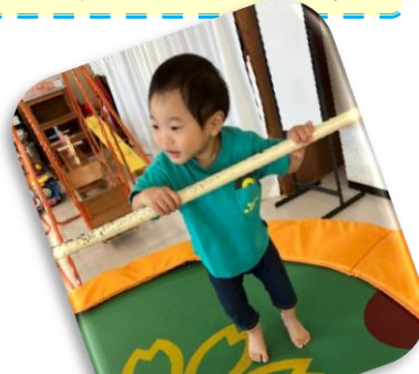
おもちゃライブラリーのトランポリン